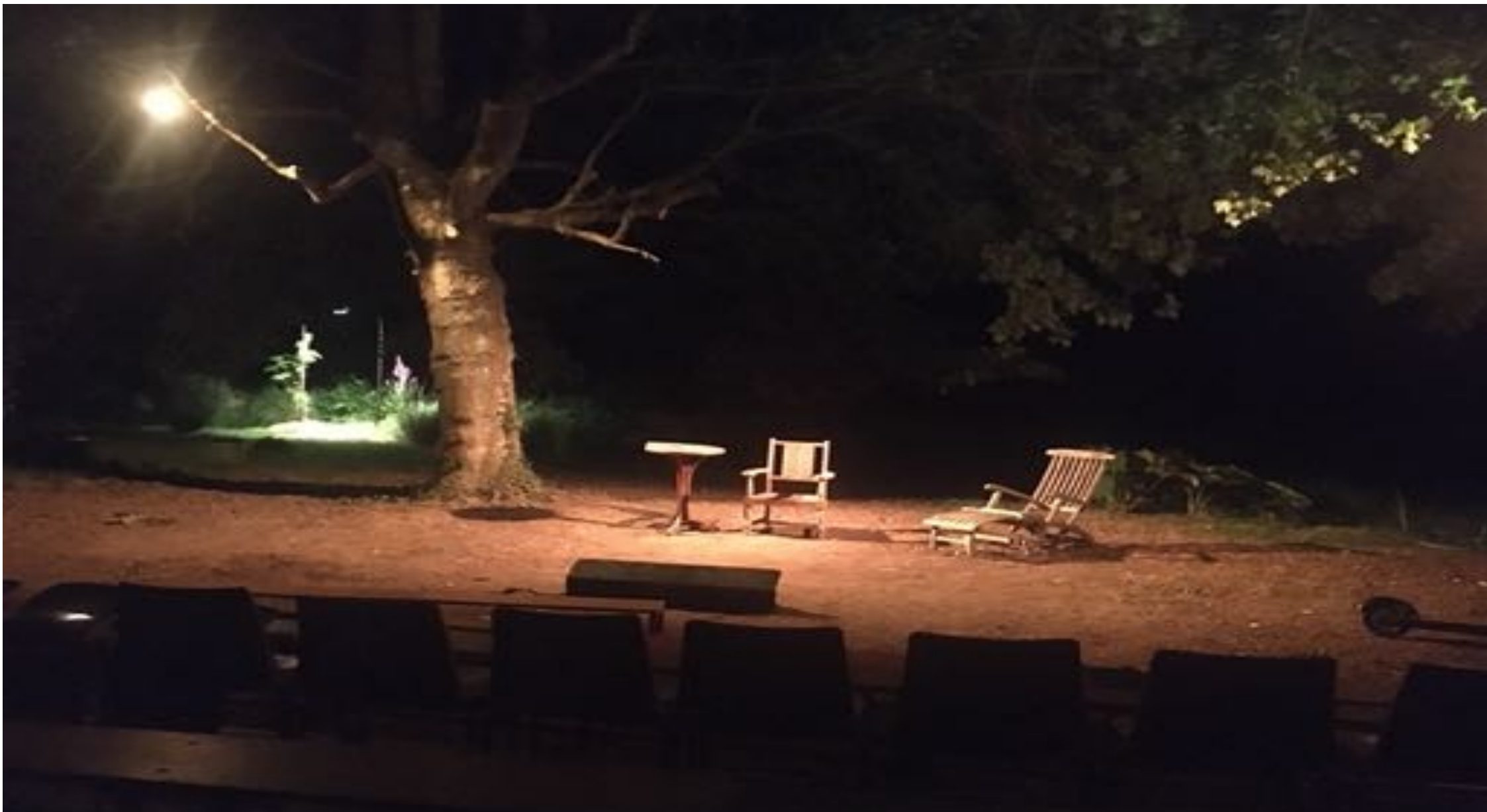
Plateau 2. Sous les érables