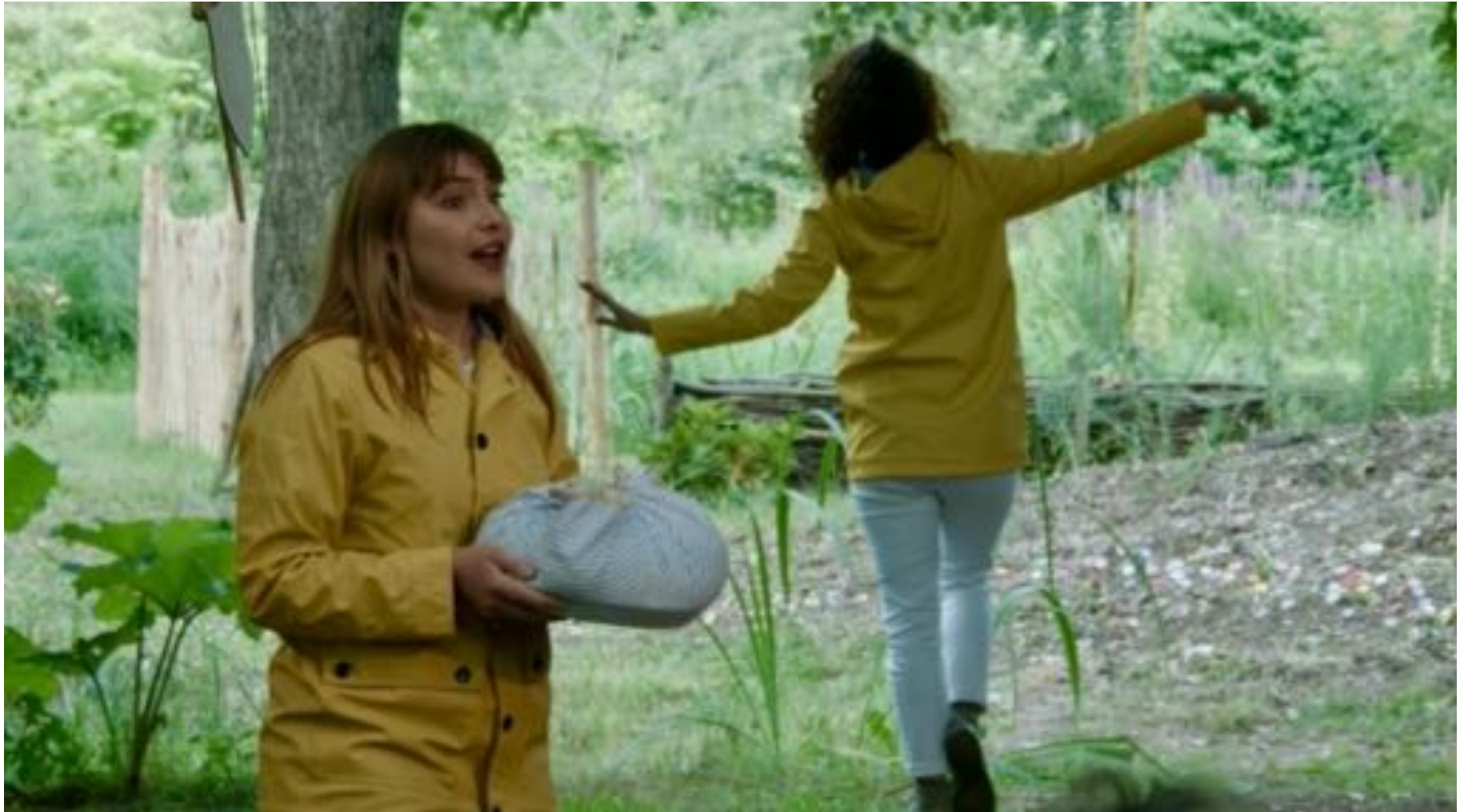
Cie Ah, si c'est comme ça