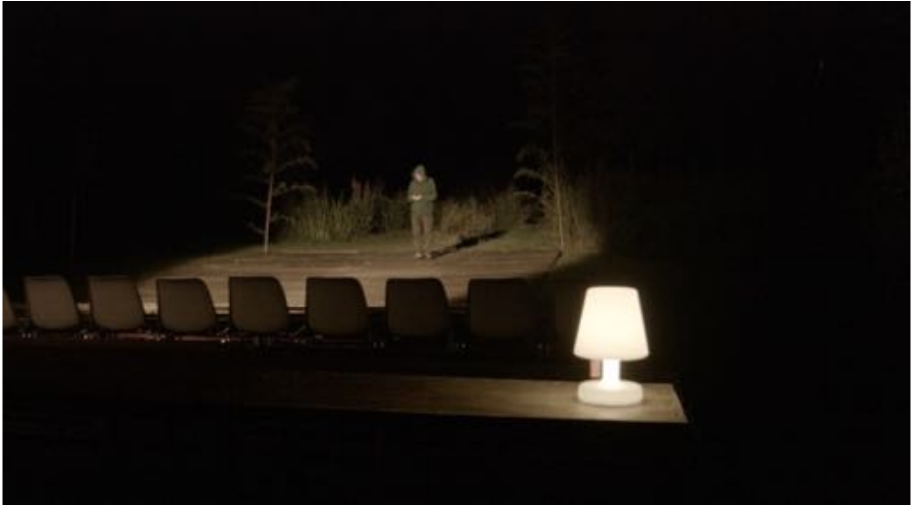
Plateau 1. Réglages lumières. Luc