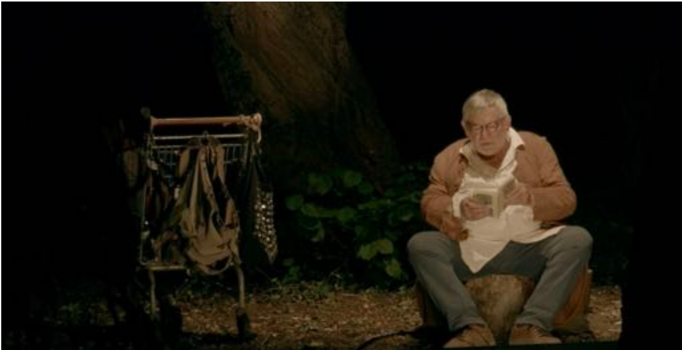
Plateau 3. Sous le saule pleureur