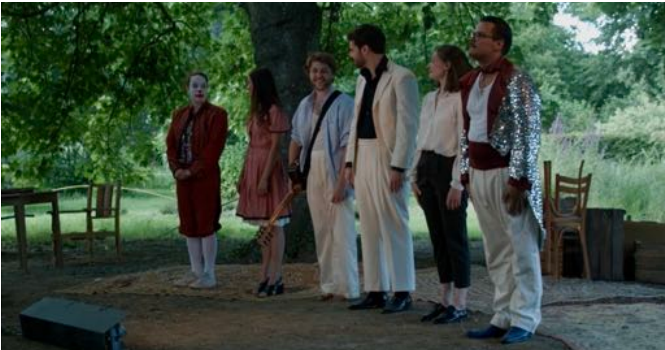
Cie Les assoiffés d'azur