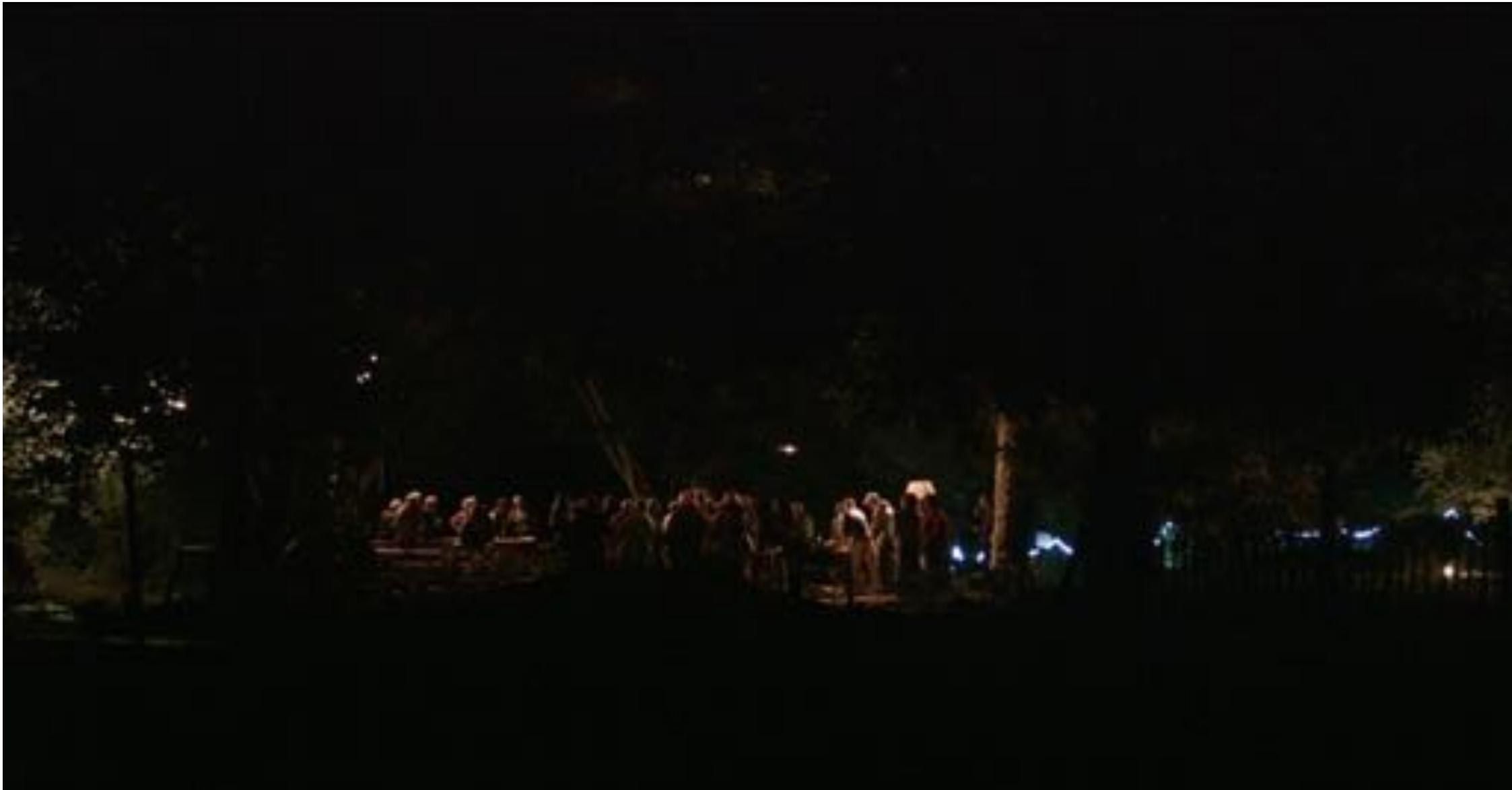
Petits fours et vin chaud